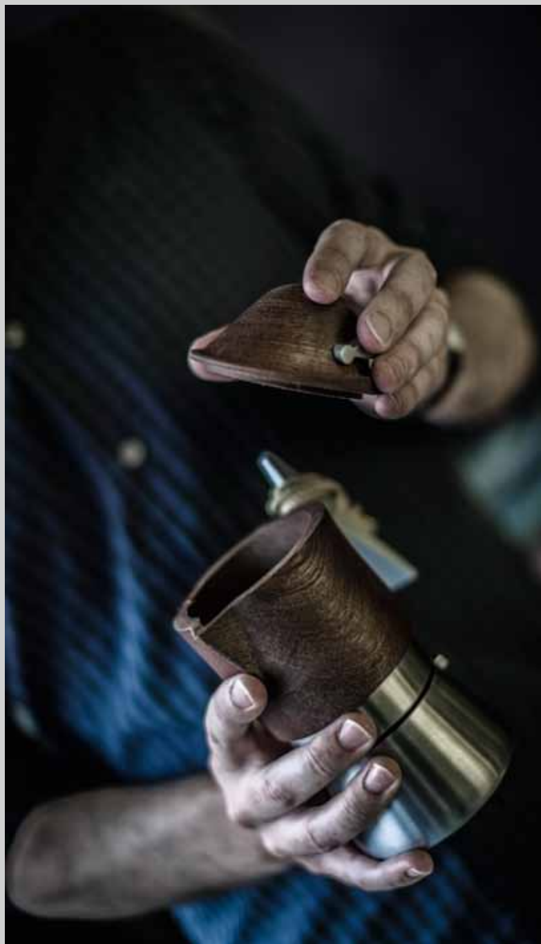
Lunika 135 nella sede dell'Associazione Alpini di Ameno (NO)

Per realizzare il nuovo raccogliatore, è stata parzialmente accantonata la lavorazione classica di Lunika; da un blocchetto di legno massello si ricava quindi una prima sagoma, utilizzando una fresa a pantografo. Successivamente il semilavorato è rifinito con una fresa a controllo numerico, che permette un'alta precisione di realizzazione.