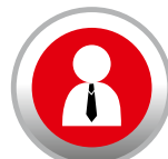
CONSULENZA E SOLUZIONI