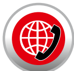
INTERNET TELEFONIA - TELEFAX