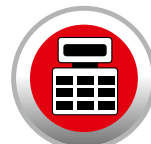
REGISTRATORI DI CASSA