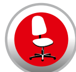
ARREDI PER L'UFFICIO